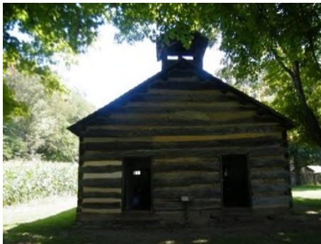
Škola ve Schoenbrunu byla první školou ve státě Ohio