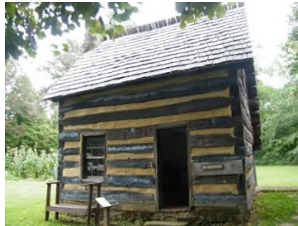
Chata Davida Zeisbergera – replika ve skanzenu Schoenbrun