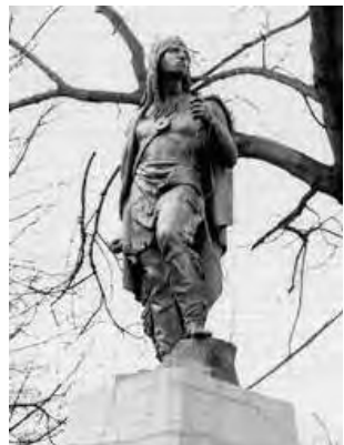
Kapitán dýmka-jako národní hrdina