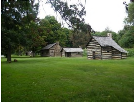
Skansen v místech, kde stála Zeisbergerova vesnice Schoenbrun – Ohio USA